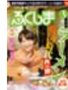
シティ情報 ふくしま

〒960-2153 福島市庄野字柿場 1-1 (日進堂印刷所本社 2F) Tel 024-593-0500 (代) Fax 024-593-0400 URL http://cjinavi.jp/