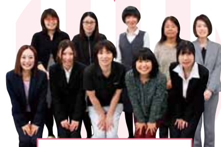
日進堂グループ 「女性のイチオシ委員会」

日進堂グループ(日進堂印刷所、進和クリエイティブセンター、エス・シー・シー)の女性社員のみ10名で構成された委員会。2013年4月に発足し、女性社員へのアンケートをもとにした「職場環境の改善提案」、女性社員同士の「情報共有化」などを行ってきました。現在は、昼食を共にしながら交流を図る「イチオシ女子会」を定期的に開催し、部署の垣根を越えて親交を深めています。